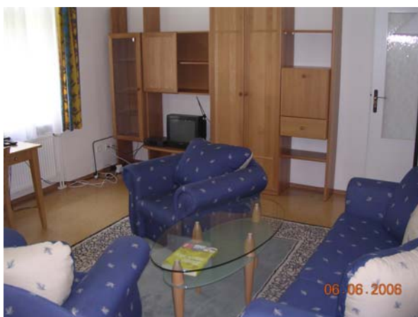
obývací pokoj 104